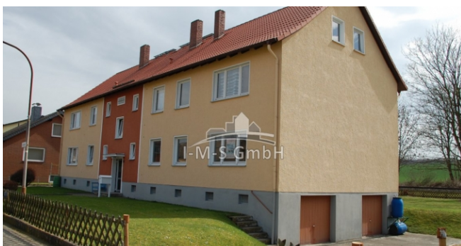
schlesier weg 122