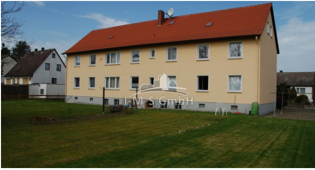
schlesier weg 123